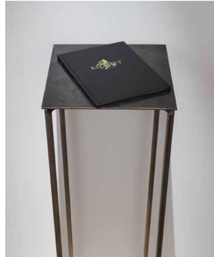
Yelta Kôm, Kazara gerçek, mat fiber baskı, çeşitli boyutlar, 3+1 AP