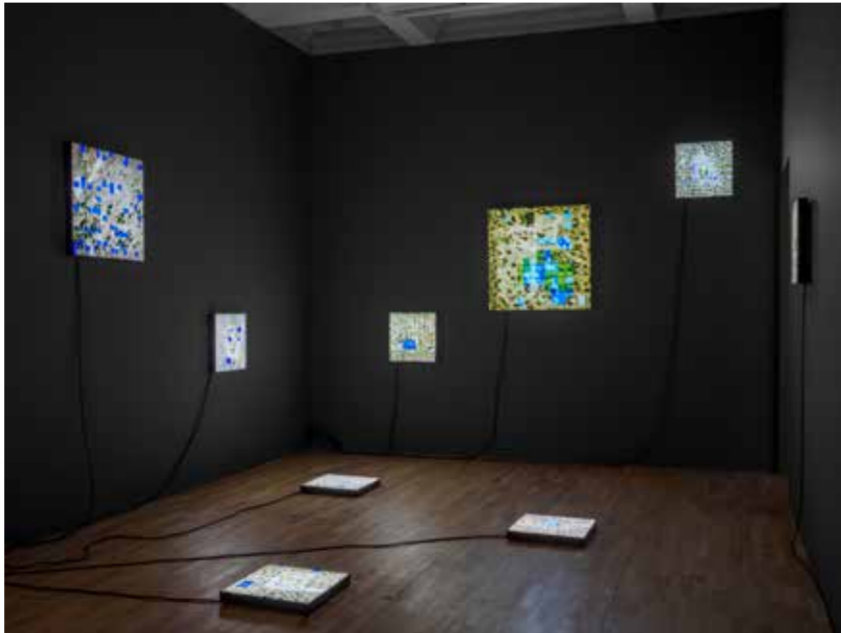
Yelta Kôm, Olmayan yerlerde buluş benimle , 2023, yerleştirme, 9 adet ışıklı pano, video, çeşitli boyutlar, 2+1 AP